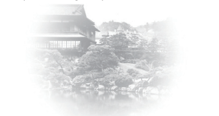
Imagem do Jardim Sorakuen antes da Guerra Pavilhão Principal Shofukan

Venha fazer uma viagem pelo tempo no período Meiji, imaginando o senhor feudal que aqui viveu e o jardim cuidado pelo seu jardineiro.