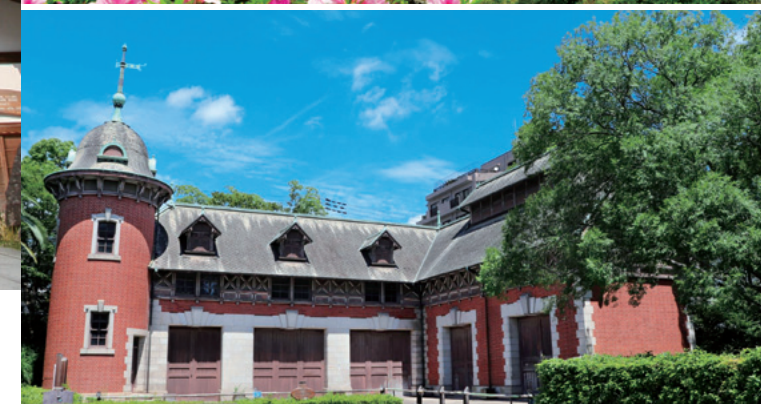
Pabellón principal del Sorakuen antes de la guerra (Shōfūkan)