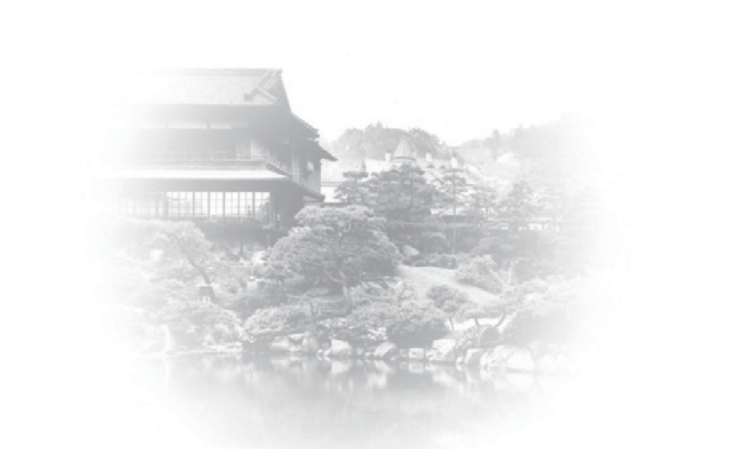
Ansicht von Sorakuen vor dem Krieg (Shofukan)

Gartenmeister vor über 100 Jahren erschaffen haben.