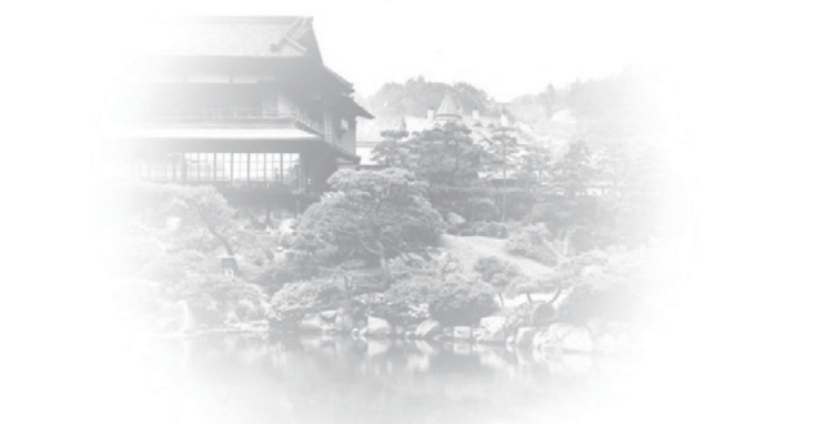
Sảnh chính của TƯỜNG LẠC VIÊN trước chiến tranh SHOFUKAN (PHONG QUÁN CHUƠNG)

cổ thời Minh trị được tạo ra bởi chủ nhân và những nghệ nhân làm vườn.