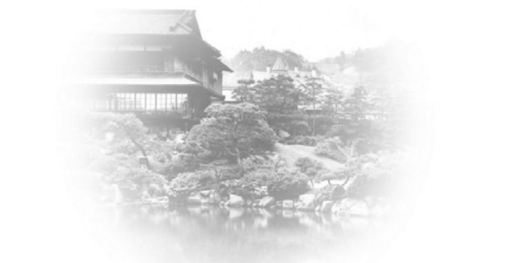
Pabellón principal del Sorakuen antes de la guerra (Shōfūkan)

Evocamos al propietario que en la era Meiji planeó este jardín, y al maestro jardinero que lo diseñó y construyó.