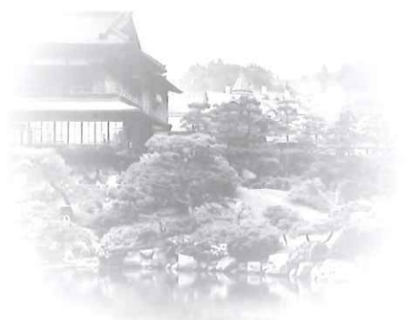
Sảnh chính của TƯỜNG LẠC VIÊN trước chiến tranh SHOFUKAN (PHONG QUÁN CHUÔNG)

Mọi người có thể chiêm ngưỡng tại nơi đây những kiến trúc và đình viên cổ thời Minh trị được tạo ra bởi chủ nhân và những nghệ nhân làm vườn.