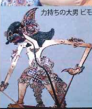
力持ちの大男ビモ