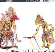
魔王ラワナとラーマ王子